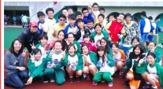
板橋區比賽獲亞軍，全體合影

但事情還沒解決呢。接棒不順一直是本班急需解決的問題，無論是掉棒或是超出接力區都是時常發生的事，為了解決這個狀況，好屌老師更是不斷的調動棒次以協助同學接得更順利。除此之外，不知是天氣越來越冷，還是傷兵不斷地增加，大隊接力的秒數不減反增，簡直是越練越沒信心了；而各方認為我們代表資格不符的輿論也接踵而至，幾乎快引起班與班的口舌之爭了。這時導師與體育老師只能不斷地勸說：「一定要用實力證明一切，這才是解決之道！」這才讓同學稍安勿躁，慢慢沉住氣。