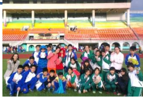
在低溫 9 度下跑完大隊冠軍

大隊接力是開學以來全班最期待的事了。終於，在 11 月份的一次體育課中，我們在大隊接力的友誼賽裡，跑出了 5'23 的好成績，也因此獲得了代表學校參加校外板橋區的比賽資格。突然有了這份榮譽與責任，也為了在校內的比賽能獲得真正的第一，全班決定在放學時額外留下來加練。