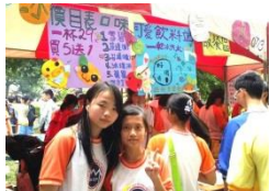
719 園遊會攤位現場

本攤位在叫賣的過程中，最大危機就是冰塊一直不夠，所幸導師和家長們輪流到外面買冰塊來化解危機。但杯子和吸管賣到最後居然也不敷使用了，這時只好靈機應變，拿出「舊的」杯子和吸管「回收再利用」，所以現在想想，我們應該不只賣 600 杯吧。整個開賣現場，我們班導全場坐鎮，不管是三教九流，全部都被拉進來買汽水，同學們也在後台努力的組杯、裝冰塊乾冰、倒充滿是氣的汽水（飲料明顯份量不多）、櫃台收錢找錢等等，終於在園遊會結束前賣個精光，提前收工回家。