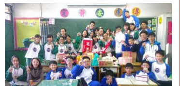
12/30 度功宴，與獎牌旗標禮物實品合影留念

12/17 的複賽與決賽當日，堪稱是有史以來海山大隊接力賽的最低溫，僅僅只有攝氏 9 度。大家在不畏風寒下只穿著短袖短褲運動衣，在跑道上來回的練習以保持身體的熱度。全班更想盡辦法要提振士氣，不斷的大喊加油口號，甚至還齊唱《堅持》這首歌來表達我們一定會贏的希望，而每場賽前導師更提供了「元氣巧克力」以增加大家的能量後，終於，我們以複賽 5'12 分組第 1 名，進入了下午關鍵的決賽。